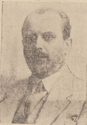
Marszałek Sejmu prof. Wacław Makowski