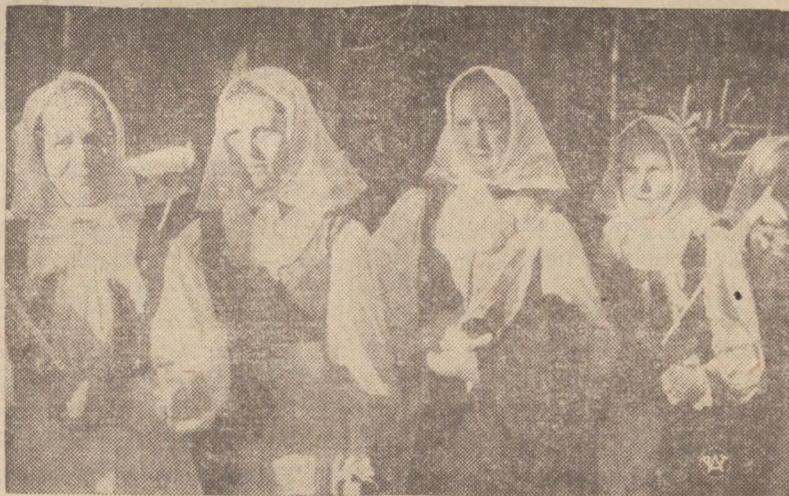
Góralki z Jaworzna witają wojska polskie chorągiewkami o barwach narodowych

Po złożeniu hołdu Panu Prezydentowi R. P. na Zamku, podchorążowie przemarszerowali Krakowskim Przedmieściem na plac Józefa Piłsudskiego, gdzie delegacje wszystkich szkół podchorążych złożyły wieniec na grób Nieznanego Żołnierza.