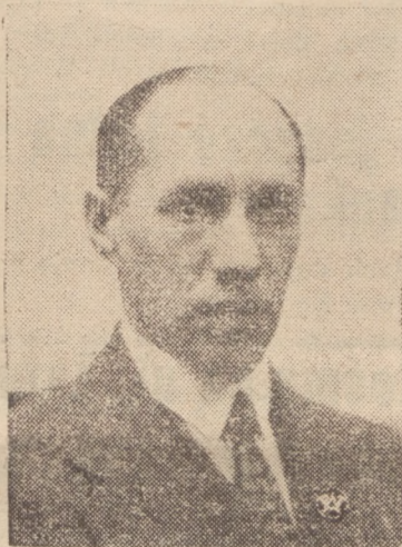
Marszałek Senatu plk. Bogusław Miedziński