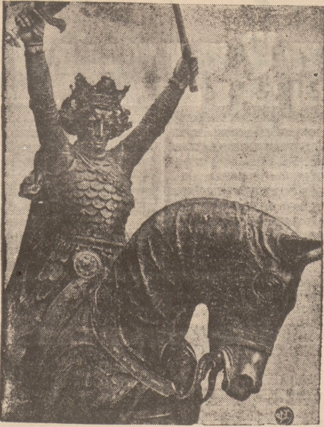
PO OTWARCIU PAWILONU POLSKIEGO NA WYSTAWIE ŚWIATOWEJ W NOWYM JORKU.

Jak już doniosły depesze, przedstawiciel rządu polskiego minister Roman dokonał w dniu 3 maja, w towarzystwie ambasadora Połockiego i wiceministra Bobkowskiego, uroczystego otwarcia pawilonu polskiego