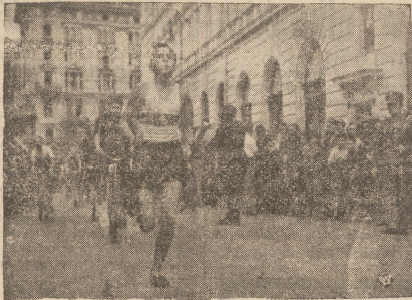
BIEG SZTAFETOWY RALZYMIN — WARSZAWA

W dniu 20 bm, na Placu Marszałka P. I. sułkiewskiego w Warszawie odbyło się zakończenie dorocznego biegu sztafetowego Ralzymi — Warszawa dla uczczenia pamięci ci poległych w 1920 r. Po zakończeniu