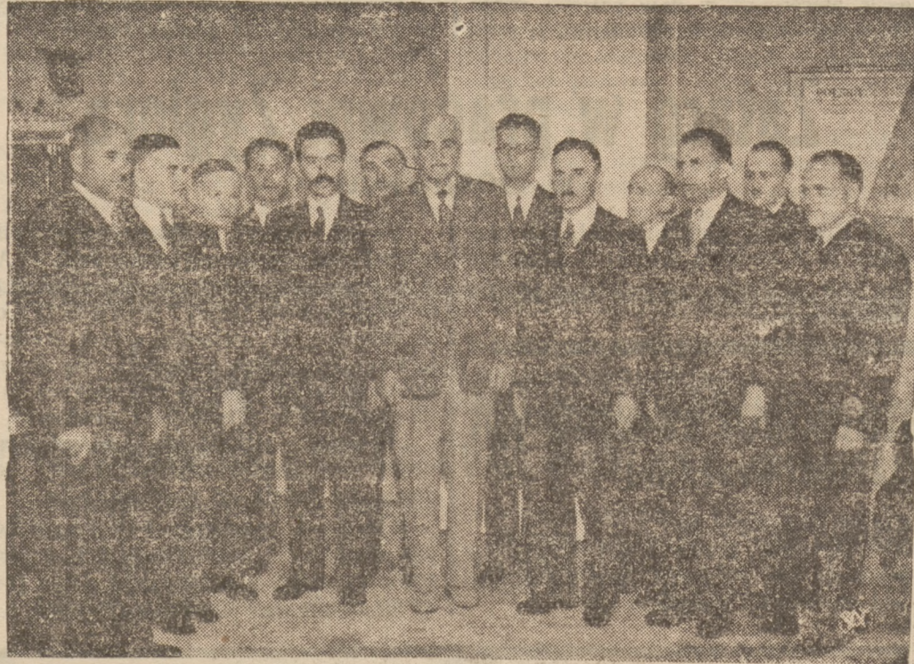
AUDIENCJA W SPAŁE

Dnia 19 bm. Pan Prezydent Rzeczypospolitej przyjął w swej rezydencji w Spałach przedstawicieli Centralnego Zw. Młodej Wsi