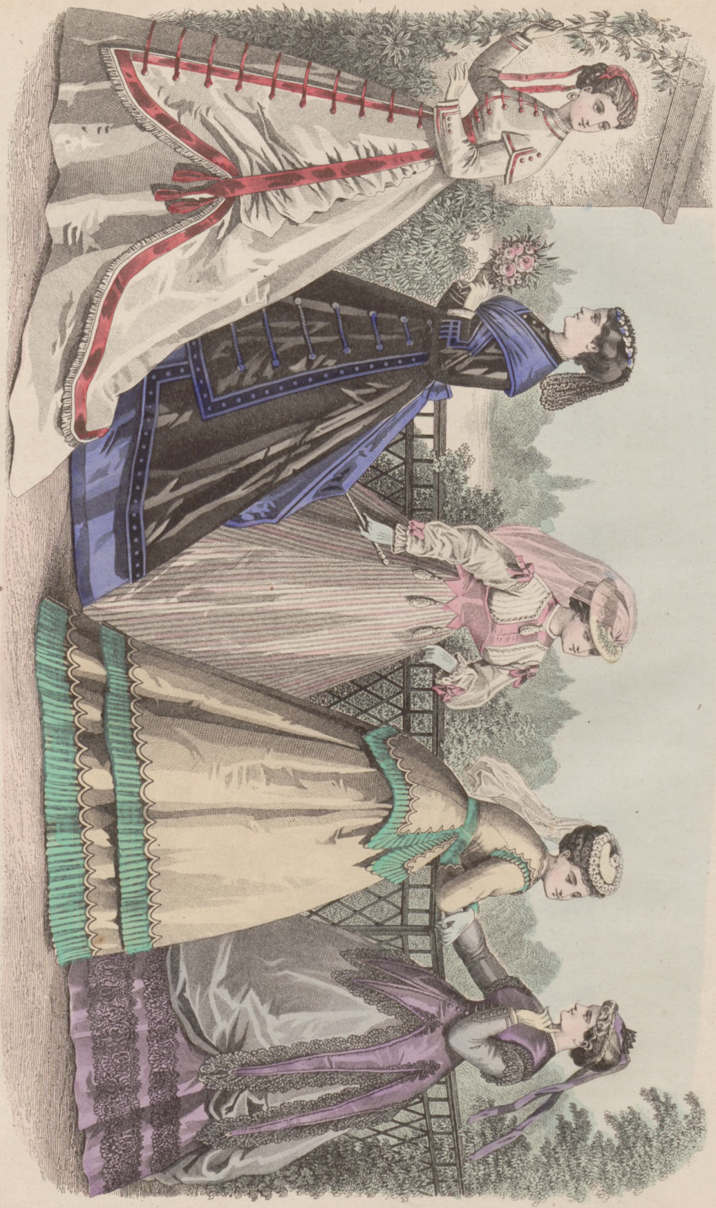
KÓŁKO DOMOWE Październik 1867 r.