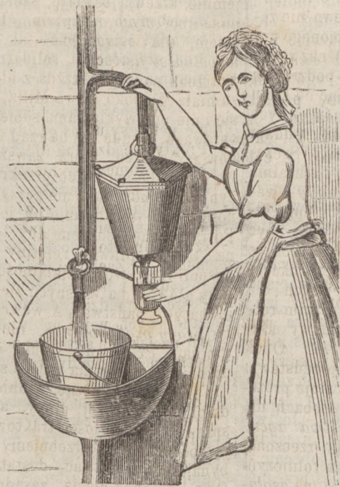
Fig. 57. Filtr wodociągowy Büringa.