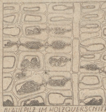
BLAUPEILZ IM HOLZQUERSCHNITT

Jak wygląda grzyb powodujący sinienie w poprzecznym przekroju sosny?