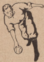
Fig. 4. Zadawacz.

Zadawacz (1) staje wewnątrz czworoboku na polu (C). Stosownie do prawideł musi obiema piętami stać na tylnej linii granicznej pola (C), przez co ograniczoną jest do pewnego stopnia szybkość zadawania. Jest mu jednak dozwolonem piłkę zadawać z wirowym obrotem. Według dawnych prawideł także jedna pięta (lewa, jeżeli zadaje prawą ręką) stała na granicy tylnej, druga noga była w wykroku. Z tej postawy można było szybciej zadawać, ale nie było dozwolonem puszczać ją w obrót wirowy. Ten też sposób polecamy druhom Sokołom, którzy grę tę myślą uprawiać.