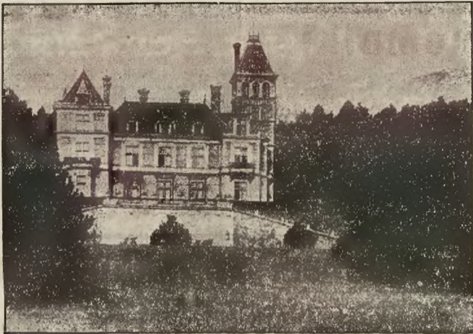
W związku z opublikowaniem nowej konstytucji w Austrii, co ma wkrótce nastąpić, utrzymuje się pogłoska, że rodzina b. cesarza austriackiego będzie mogła wrócić do kraju i zamieszkiwać będzie zamek Wartholc w Reichenau.

Druga strona tj. Chrześcijański Związek Gospodarczy, grupujący wszystkie żywioły stojące na gruncie narodowym i katolickim na razie nic nie wykazuje żywszej działalności. A czas się już ruszyć. Nastroje pomyślne. Hasło obrony polskiego