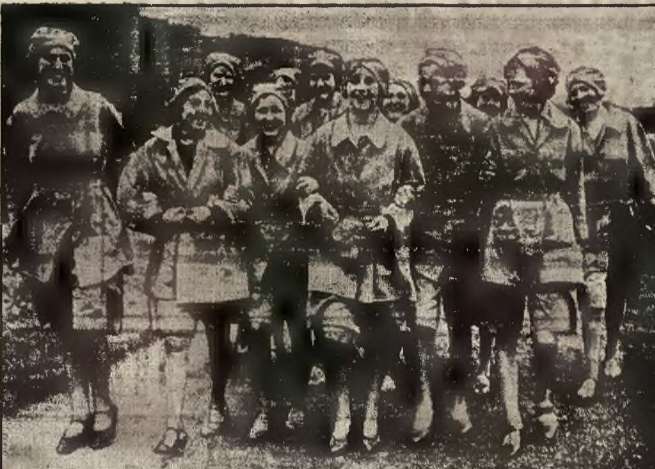
Moda, wprowadziwszy krótkie spodełki dla kobiet: tennisistek, wioślarek i plażowniczek, rozszerzyła się obecnie i na pracownice fabryczne. Początek dała jedna z wielkich fabryk angielskich. Pracownice czują się w tym nowym przebieżnym i wygodnym stroju doskonale.

Huculszczyzna Pistyn kolo Kosowa pensjonat „Adamówka”, poleca komfortowe pokoje od 15 maja. Tenis, siatkówka, radio. Ceny umiarkowane. 17135