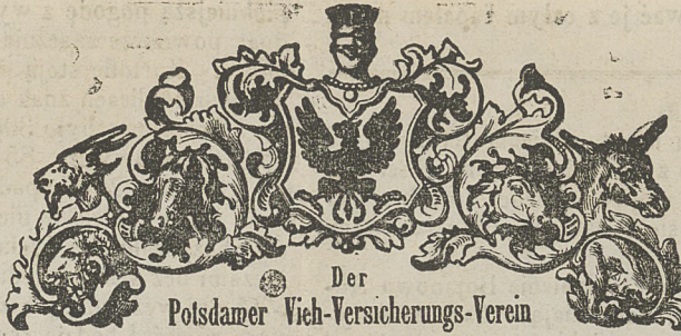
Der Potsdamer Vieh-Versicherungs-Verein

stów i źrebców po 3½ 0/0, zaś koni furmańskich po 5 0/0 wartości szacunkowej, a świni i kóz po 24 Sgr. za sztukę.