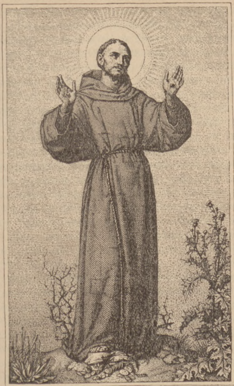
ŚW. N. O. FRANCISZEK SERAFICKI (4 Października).