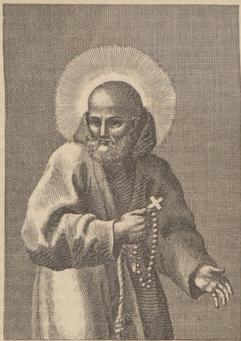
Św. SERAFIN z Monte Granaro.