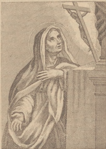
Św. Brygida szwedzka.