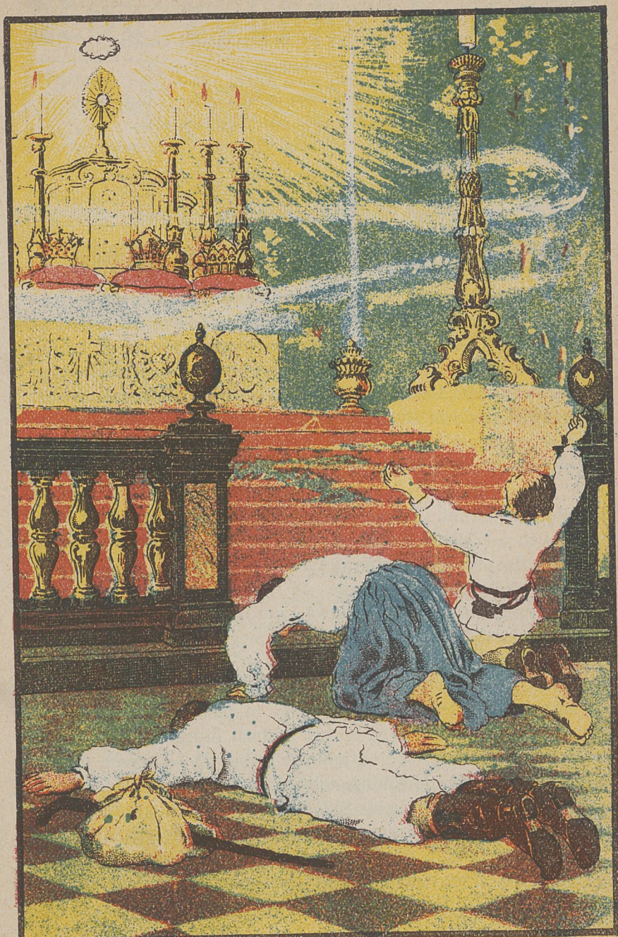
Obraz malował p. J. M. Krzesz, Kraków.