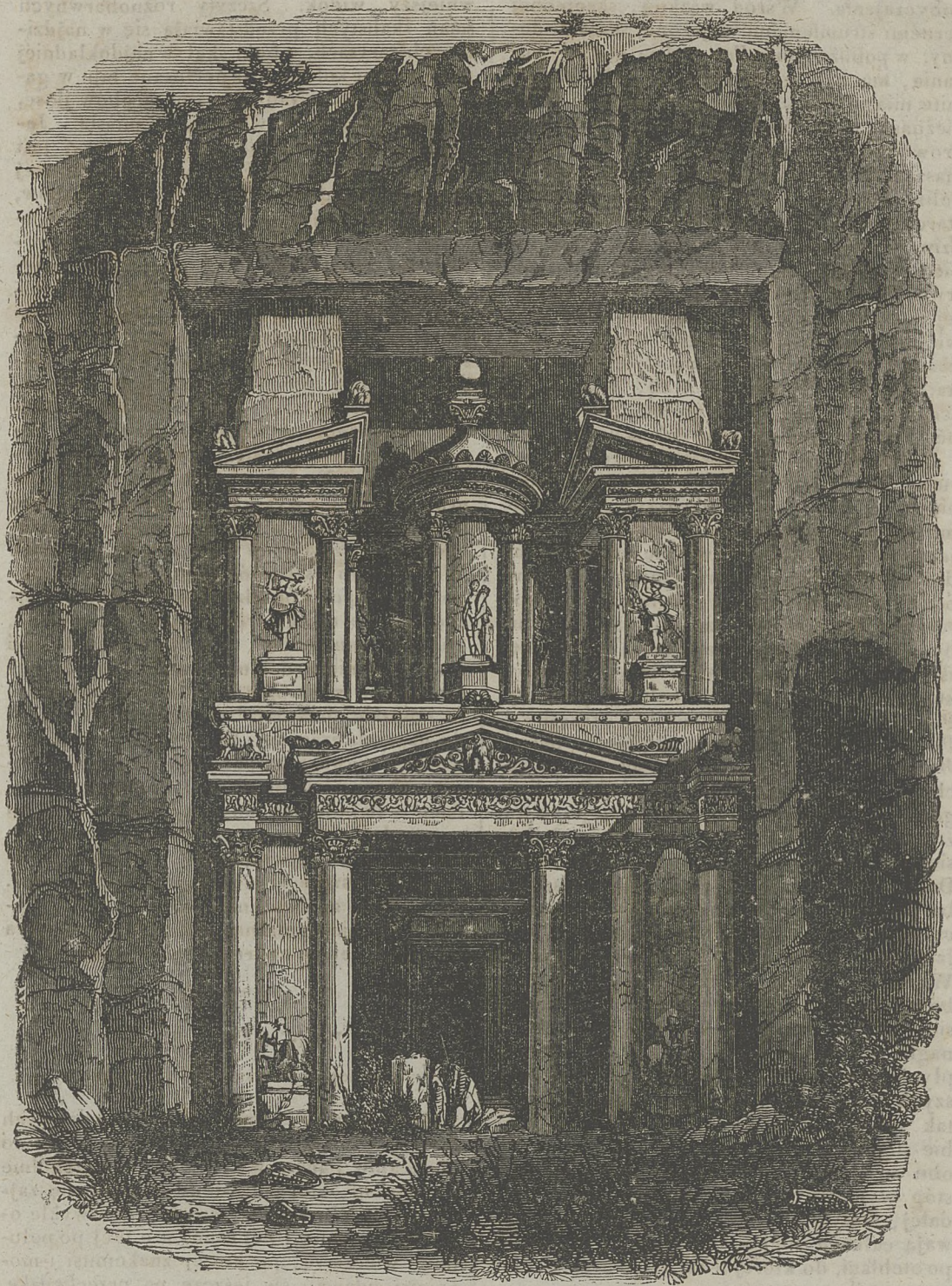
(WIDOK ŚWIĄTYNI W PETRA.)