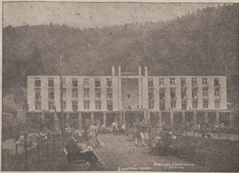
Nowy Dom Zdrojowy w Żegiestowie-Zdroju.

W r. 1866 zaprosił szacownie znanego wówczas chemika A. Aleksandrowicza do uporządkowania i ponownego chemicznego rozbiore wody. Aleksandrowicz przekonawszy się, że źródła Anny i Marji składem chemicznym są do siebie