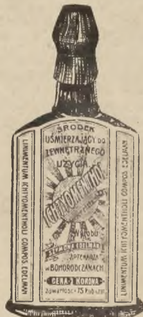
Flaszka bez opakowania.