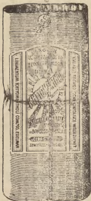
Flaszka w oryginalnym opakowaniu.