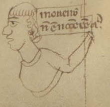
monens n' enax' a'

Marginal notes on the right side of the page.