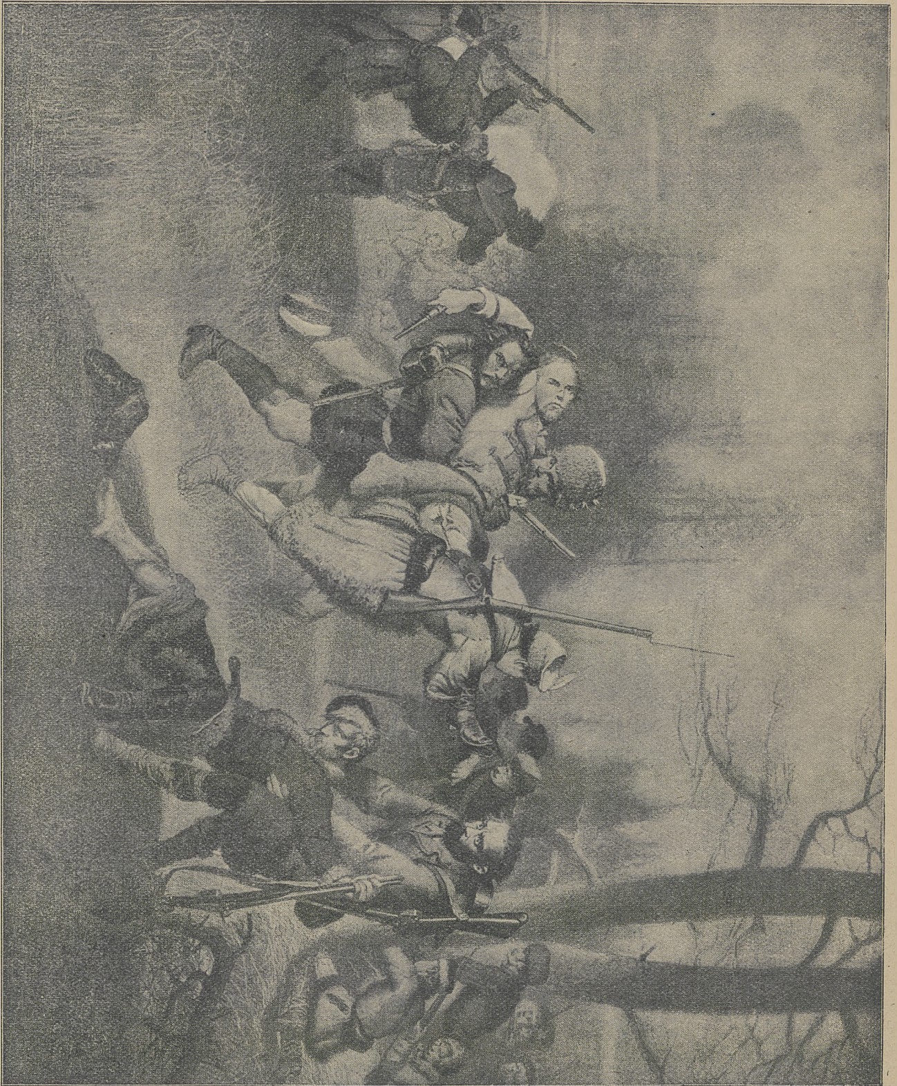
W alka porwanińców z Moskalami