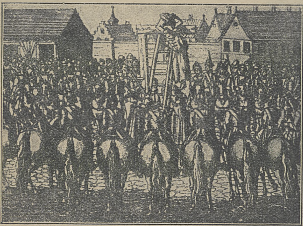
Powieszenie Łokiszewskiego w Sandomierzu