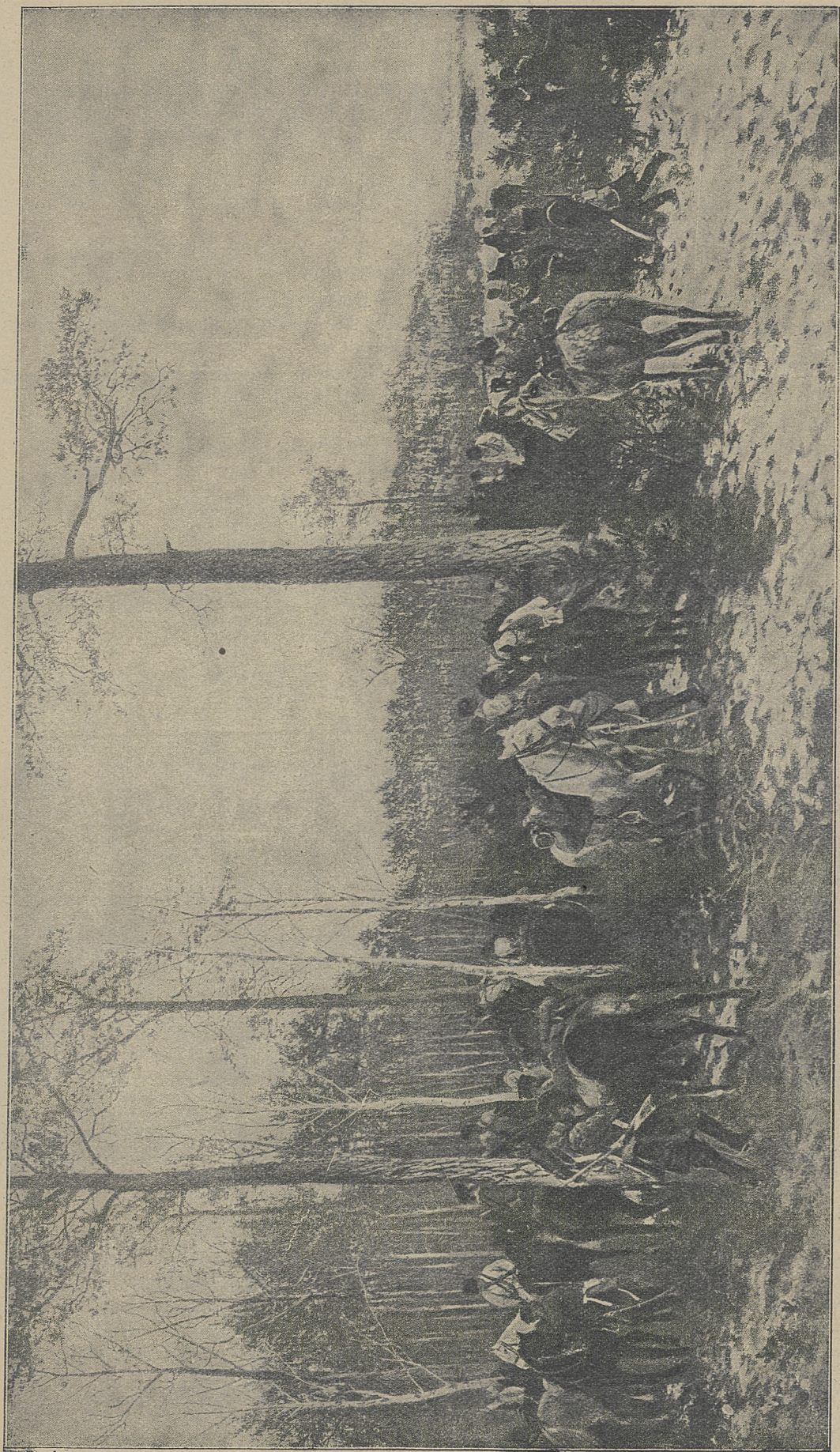
Alam w obozie