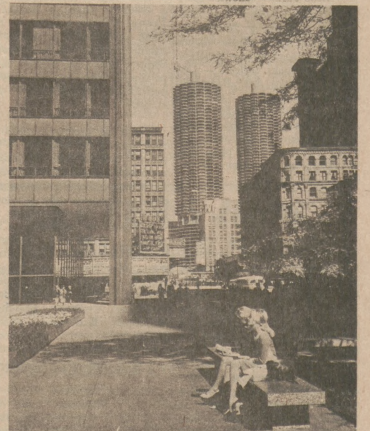
CHICAGO. — "The Civic Center Plaza" mieści się w centrum śródmieścia Chicago. Z tego miejsca można rozpocząć zwiedzanie miasta. W tyle widoczne są dwa oryginalne budynki Marina City.