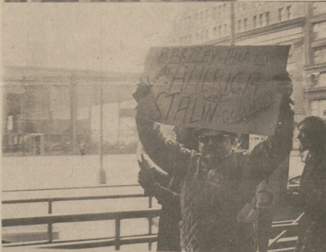
Jak już podawaliśmy — w sobotę, 15-go marca przeszło tysiąc Polaków i Amerykanów polskiego pochodzenia demonstrowało przed budynkiem federalnym w Chicago, protestując przeciw wypowiedziom o Polakach dyr. biura imigracyjnego W. Bartley i metodom stosowanym przez jego agentów wobec pracujących turystów z Polski.