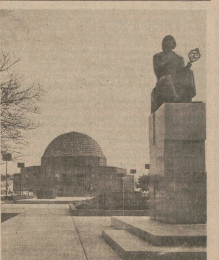
CHICAGO. — Jedną z największych atrakcji naszego grodu, godną obejrzenia, jest sławne "Adler Planetarium". Przed budynkiem znajduje się piękny pomnik polskiego astronoma Mikołaja Kopernika, niedawno ufundowany i ofiarowany przez Polonię miastu Chicago.