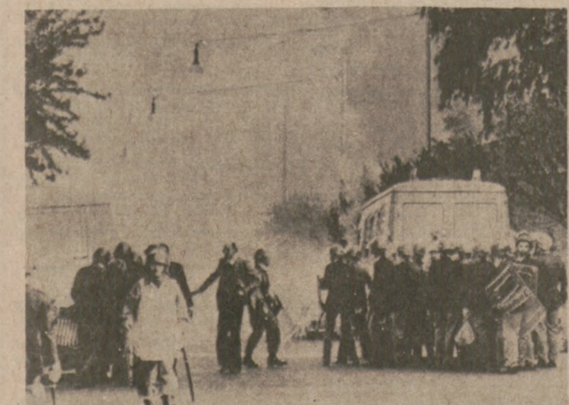
RZYM. — Na terenie Uniwersytetu Rzymskiego doszło do starcia pomiędzy studentami i policją. Jeden policjant został zabity, a korespondentka amerykańskiej telewizji odniosła obrażenia.

Następne zebranie Komitetu Stypendialnego odbędzie się 9 maja.