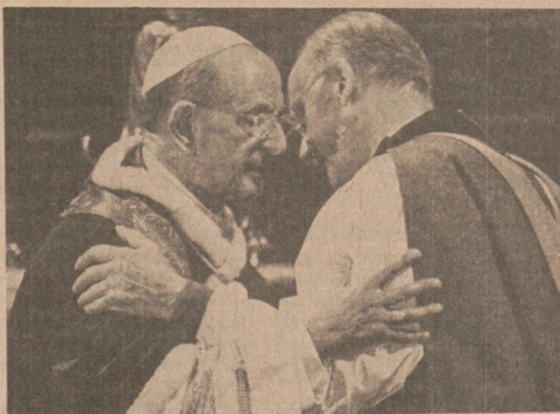
WATYKAN. — Papież Paweł VI (po lewej) obejmuje Arcybiskupa Canterbury, dr Donalda Coggan, po ceremonii w kaplicy sykstyńskiej.