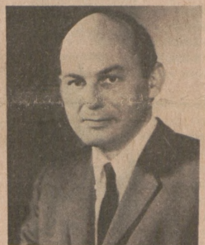
SEN. ADLAI E. STEVENSON, Główny Mówca Obchodu

„... Na tle dzisiejszych wydarzeń przypomina nam się fakt, że to właśnie Rosja zgnębiła i unicestwiła tę pierwszą Deklarację Praw Człowieka, zawartą w Konstytucji 3-go Maja.