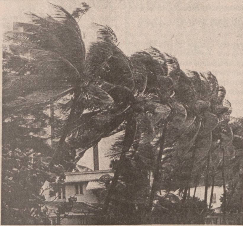
SAN JUAN. — Palmy pórprzeżinane przez wiatr — nadchodzący huragan David.

We wtorek, 18 września wieczorem na stadionie Wojska Polskiego rozegrane zostanie towarzyskie spotkanie piłkarskie Legia — Manchester City. Będzie to pożegnalny występ Kazimierza Deyny w Warszawie.