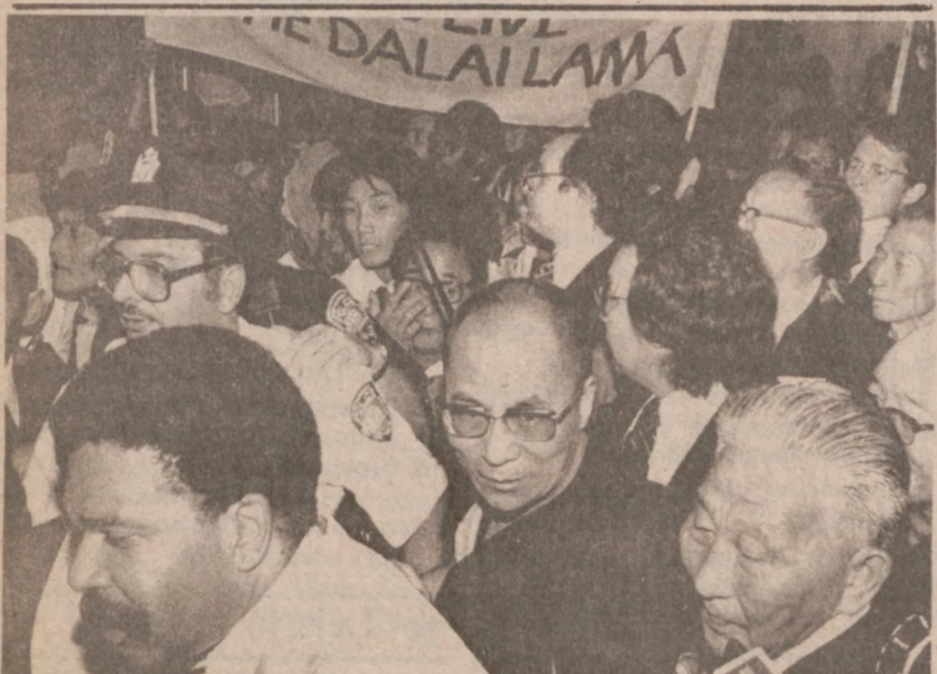
NOWY YORK. — Dalai Lama, "bóg-król" Tybetu, który żyje na wygnaniu przybył z wizytą do Stanów Zjednoczonych.

Pod tym względem nie zapowiada się na lepsze w ciągu najbliższych dni.