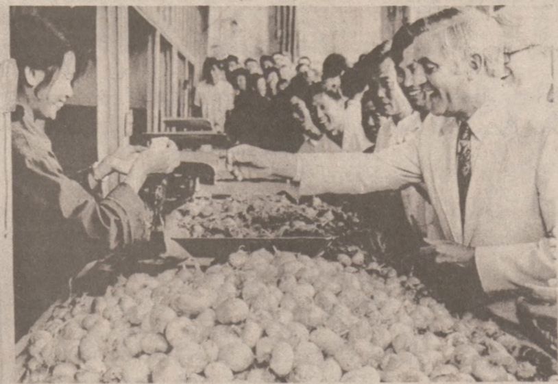
PEKIN. — Wiceprezydent Mondale odwiedził lokalny stragan uliczny w czasie wizyty dobrej woli w Chinach.