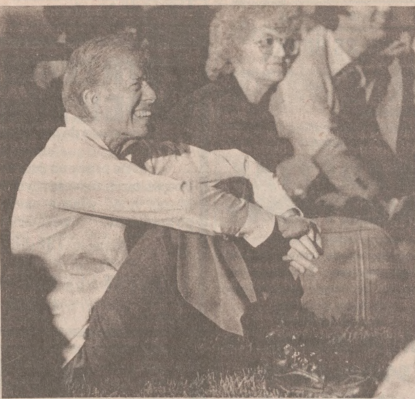
WASHINGTON. — Prezydent Carter w czasie pikniku z okazji Dnia Pracy na trawniku koło Białego Domu.

Niezależnie od powyższych postulatów, koalicja wystąpiła też z żądaniem, by mayor Byrne poparła projekt ustawy, mającej na celu wprowadzenie ostrzejszych przepisów regulujących przekształcanie mieszkań na kondominia.