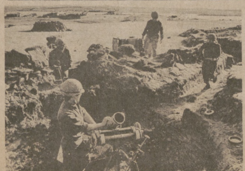
WYSPIY FALKLANDZKIE — Żołnierze argentyńscy przygotowują się do obrony wysp.

wczoraj (6,500) w jedenastym dorocznym biegu i marszu pod nazwą "Walk with Israel", zbierając sumę $300,000. Pieniądze te przesłane zostaną do Izraela na fundusz pomocy opieki społecznej, szkolnictwa, pomoc zdrowotną itp. Przedstawicielka komitetu tej imprezy stwierdziła, że wcale nie jest zaskoczona tak wielką ilością uczestników, bo pogoda była wspaniała, organizacja imprezy również, oraz społeczeństwo wykazało jak ważną jest dla nich sprawa Izraela.