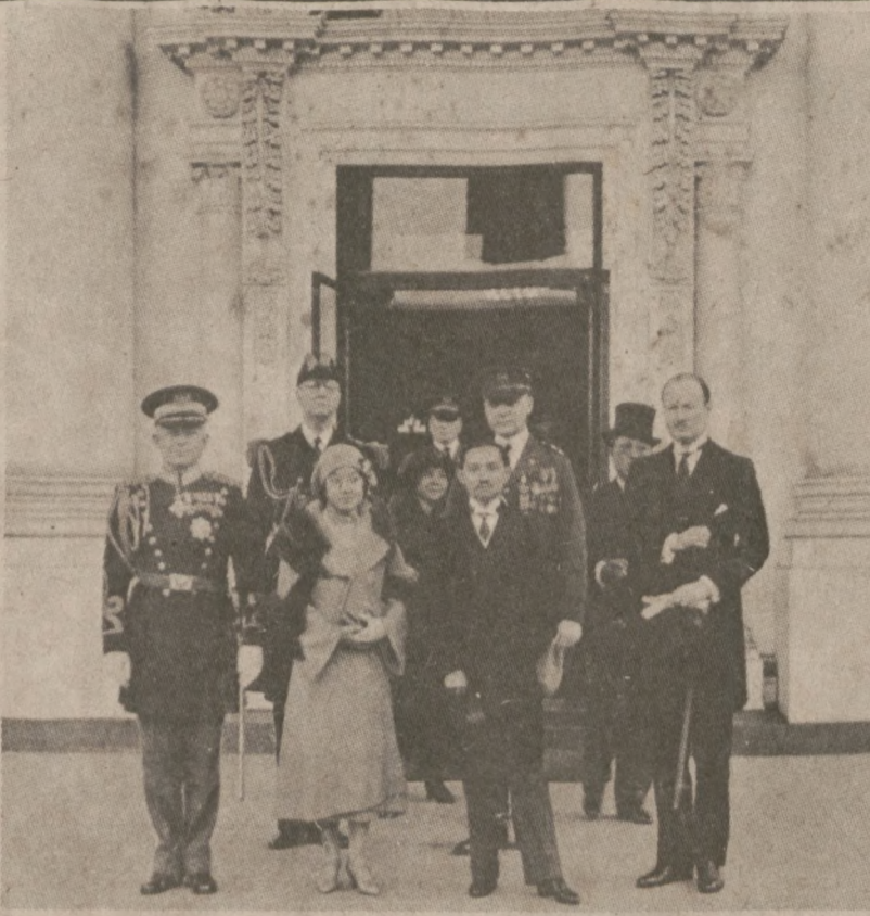
WASHINGTON — Historyczne zdjęcie upamiętniające pierwszą w historii U.S. wizytę złożoną przez absolutnego władcę, którym był król Syjamu. Wizytę tę złożono 29 kwietnia 1931 r.