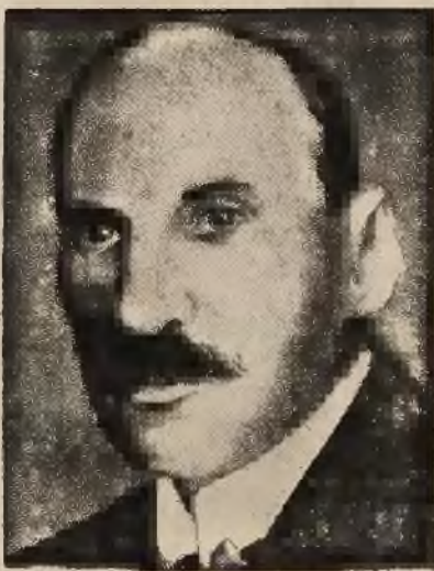
Henryk Hebertin, prezydent szwajcarskiej rady związkowej.