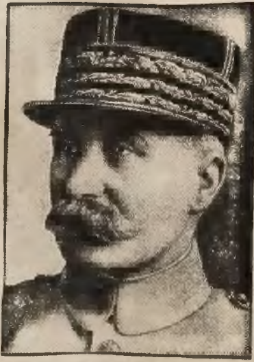
Marszałek Petain naczelnym wódz armii francuskiej,

Wśród miliona członków partji bolszewickiej nie znajdzie się dwóch jednakowych zdań co do tego, jakie gospodarstwa i do jakiej klasy zaliczyć. Na ten temat w prasie bolszewickiej, na każdym prawie zebraniu partyjnym, wśród przywódców i szeregowych partji bolszewickiej toczą się stale, długie i zażarte dyskusje, a wniosek i zasada jednakowe: Jak chcesz tak dziel chłopów, kierując się jedynie „instynktem interesu proletariackiego“ partji bolszewickiej i władzy sowieckiej. (C. a. n.).