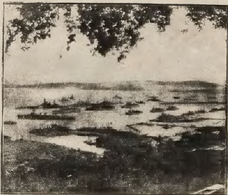
Flota wojenna Anglii, strzegąca Morza Śródziemnego i Oceanu Atlantyckiego zgromadzona przy Gibraltarze na ogólny przegląd coroczny.

J. Kunigiewicz, Strzeszyn, pow. Gorlice.