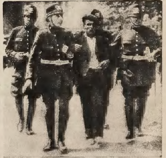
Obrazki z dni rewolucji w Hiszpanji: 1) Płonący klasztor Karmelitów. 2) Podpalony samochód na ulicy Madrytu, stolicy Hiszpanji. 3) Aresztowany agitator komunistyczny.