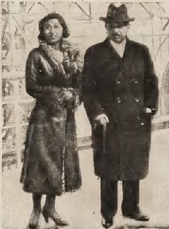
Premier Laval z córką w Ameryce.

oraz Górnego Śląska. O ile postanowienia te traktatu wersalskiego nie zostaną zmienione dobrowolnie, to należy je przeprowadzić siłą! Senator Borah stanął na stanowisku, że odebranie ziem odwiecznie polskich Niemcom, jest krzywdą i bez oddania ich z powrotem Niemcom, niema pokoju światowego!