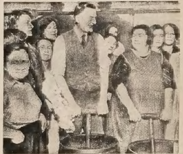
Na obrazku widzimy konserwatystę angielskiego Chamberlaina jak „agituje“ wśród praczek londyńskich. Wy-nik wyborów podamy w następnym tygodniu.

I nie wejdą... bo do prawdy wchodzi się prawda