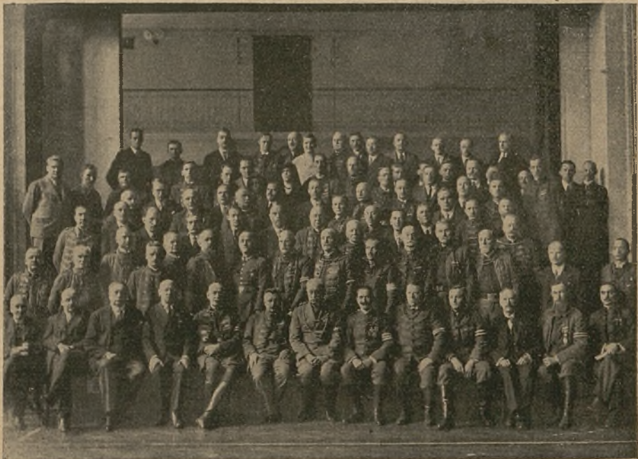
Zjazd rady dzielnicy małopolskiej we Lwowie.