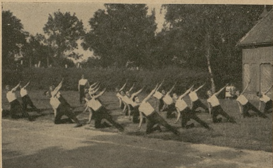
Z ćwiczeń gniazda Gostyń.

Obowiązkiem jego będzie tworzenie szkół dla nauczycieli i przodowników wychowania fizycznego, rozwijania literatury fachowej i t. d. Do najważniejszych zaś zadań tego ministerjum należy centralizacja i ujednolicenie sportów oraz jak najściślejsze współdziałanie z „Sokołem Królestwa Jugosławji” i innymi organizacjami wychowania fizycznego w państwie. Pozatem ministerjum ma zbierać dane statystyczne o wynikach