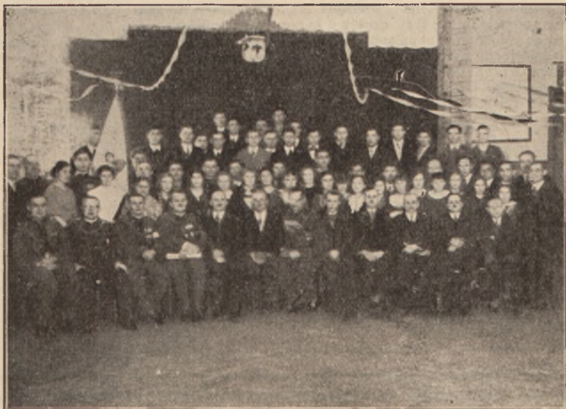
Uroczysta zbiórka Gniazda Katowice — Załężę w dniu jubileuszu.

Do prób o odznakę sportową dopuszczeni być mają tylko ci kandydaci, którzy wykażą się odbyciem przynajmniej 12 treningów w okresie od 4—12 tygodni.