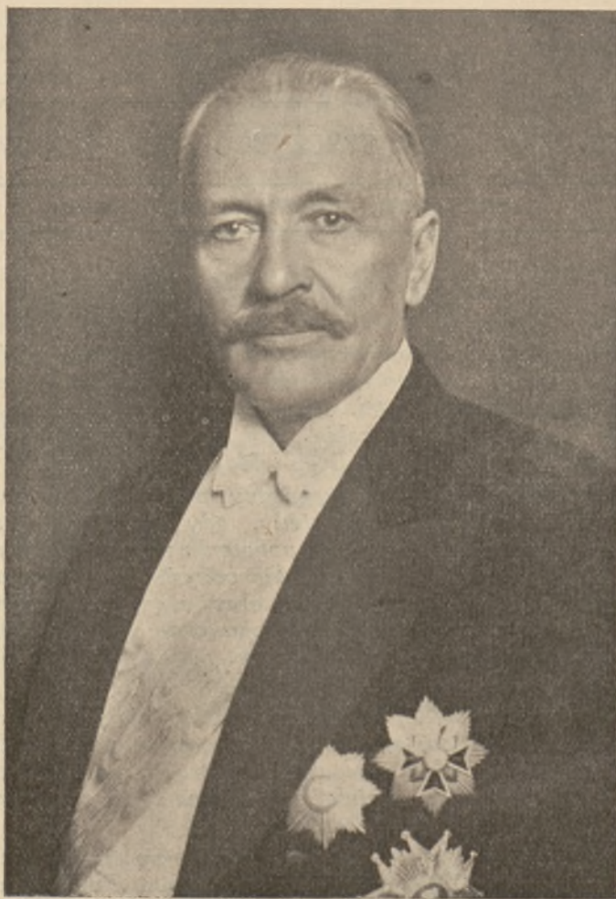
Prezydent Rzeczypospolitej Polskiej Prof. dr Ignacy Mościcki w 10-lecie Prezydentury