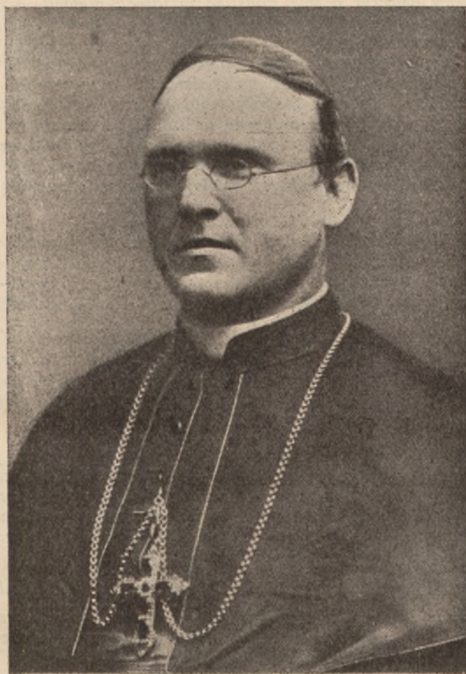
Jego Eminencja ks. Kardynał Arcybiskup Warszawski Prof. dr Aleksander Kakowski w 50-lecie pracy kapłańskiej