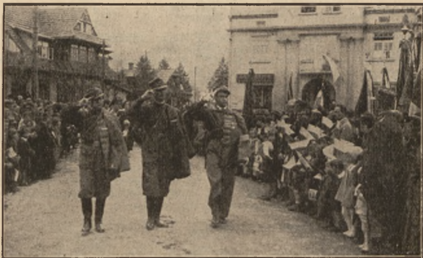
Zakopane. Z defilady w dniu 3-go maja b. r.