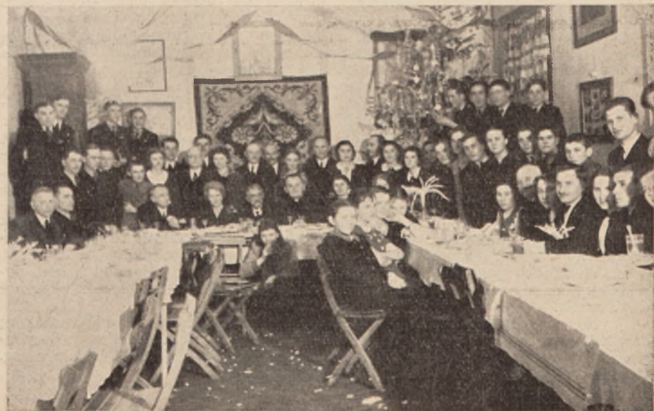
Uroczystość w Gnieździe Horodenka.

Poza więc ustawową, sądową i policyjną działalnością przeciwko komunizmowi i masonerii, trzeba przede wszystkim dążyć do rzeczywistego (nie mechanicznego tylko) zjednoczenia narodu polskiego i do jego religijnego i narodowego odrodzenia. Wówczas nie straszny będzie nacisk sił, rozkładających górę (masoneria) i dół (komunizm) naszego społeczeństwa.