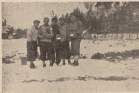
Drużyna zwycięska Sokola w marszu 2-giej Brygady.

Patroli, dla zajęcia przyznanych nam 9 miejsc, powinny dostarczyć gniazda górskie, jak: Zakopane, Nowy Targ, Jordanów, Nowy Sącz, Bielsko, Jasło, Krosno, Kałusz, Skole, Stanisławów, Kołomyja, Żywiec i Borysław, które posiadając doskonały materiał narciarski, powinny w tym mar-