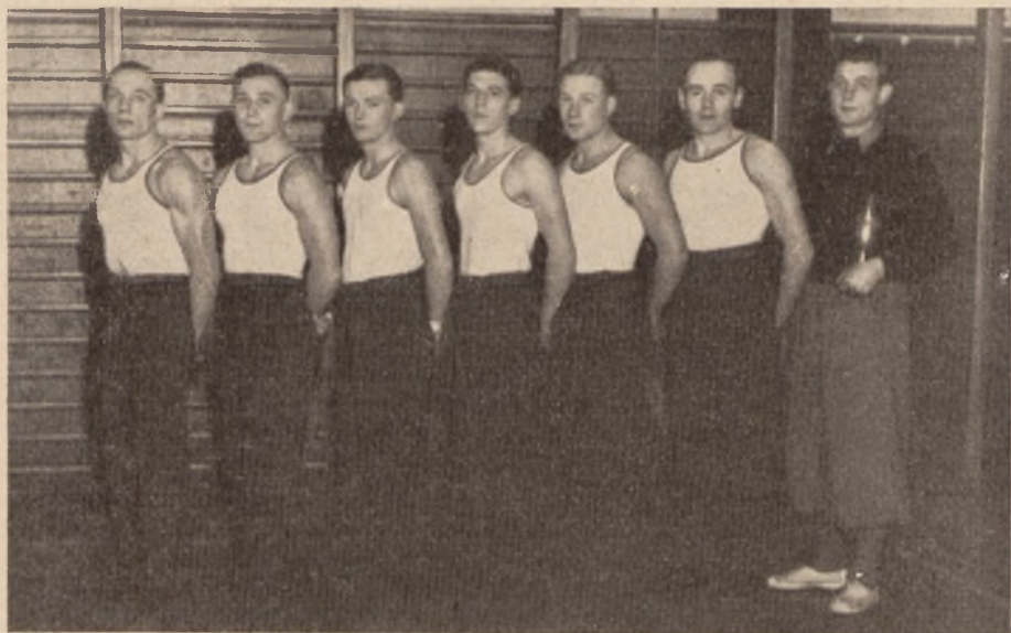
Drużyna mistrzowska w zesztórocznych zawodach gimnastycznych Polski.

Złoty Sokół wywoływały zawsze w społeczeństwie potężny zryw duchowy, były one bodźcem do ożywienia, najsukuteczniejszą walką z niemocą czy chwilową apatią. Sokolstwo łączyło się stale z rozpamiętywaniem