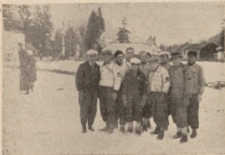
Zwycięska grupa Sokół w Marszu 2-giej Brygady.

Z wielkim trudem Związek nasz, uzyskał prawo bezpośred-