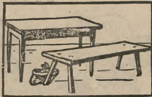
ł a w a