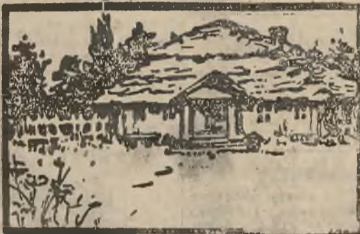
d o m