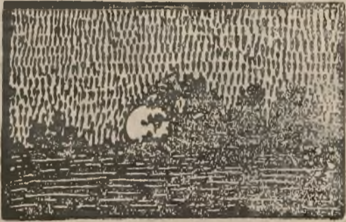
n o c