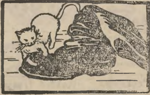
b u t