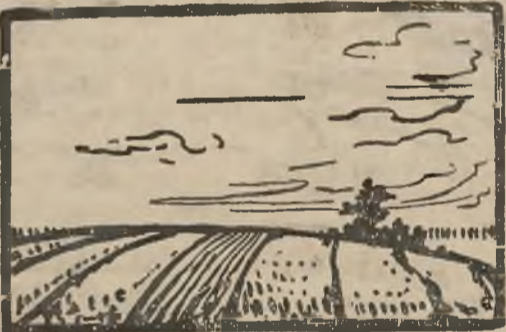
p o l e