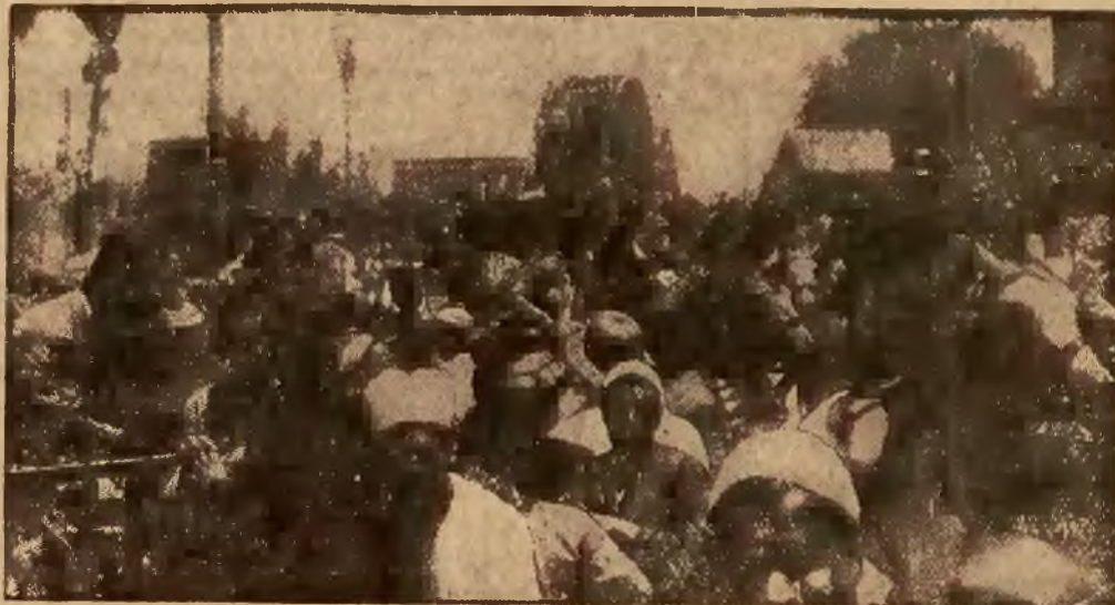
W Egipcie, jak już pisaliśmy, wybuchła przeciwko królowi Fuadowi rewolucja, a w wielkiem mieście, Aleksandriji, polala się krew. Wielu zabitych i rannych krwią swoją zboczyło oblicie bruku i ulice miasta. Na obrazku widzimy tłumy, rozpedzane przez konną policję królewską. Wrzenie zostało przez rząd opanowane.

SZWECJA JEST NAJUCZCIWSZYM KRAJEM. Kraj ten nie posiada prawie więzień. Wszystkie więzienia pozamykano tam lub pozamieniano na dobroczynne zakłady. Prócz szynkarskich wykroczeń nie notuje się w policji żadnych wielkich przestępstw. Szczęśliwy to kraj uczciwych, trzeźwych i oświeconych ludzi północy! Trzeba wiedzieć, że Szwecja jest krajem protestanckim.