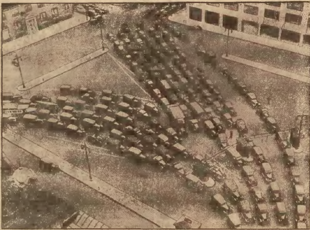
Ruch samochodowy na ulicach New Yorku w porze objadowej. Z rana i wieczorem, gdy ludność zdąża do pracy i wraca do mieszkań, bywa jeszcze więcej rzędów samochodowych, jadących obok siebie z przepisana chyżością. Kierują porządkiem światła elektryczne.