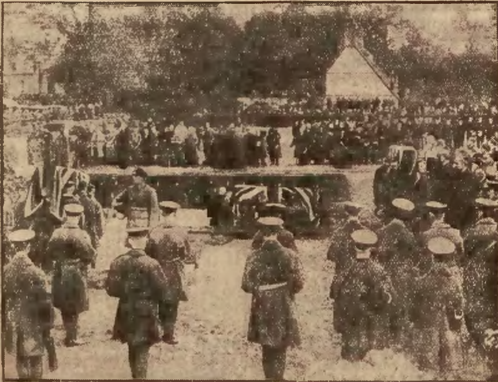
Cała Anglja składa hołd — 48 ofiarom strasznej katastrofy zepelina „R 101” — które zostały pochowane w masowym grobie w Cardigton — co przedstawia powyższy obrazek.