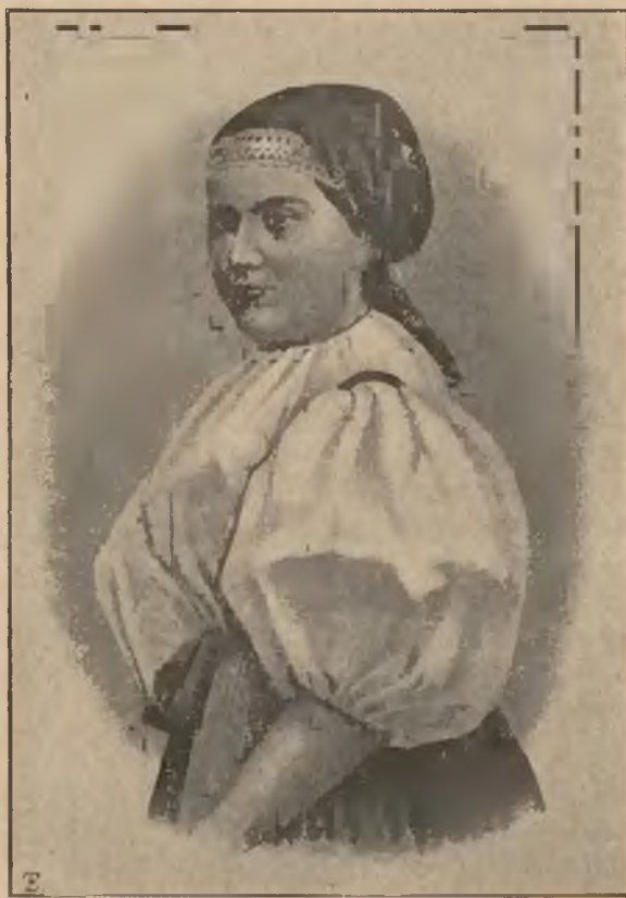
STRÓJ POLSKICH NIEWIAST W OKOLICY CIESZYNA.