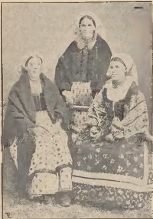
Włoszanki z pow. dąbrowskiego.