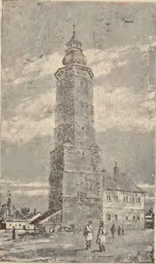
RATUSZ W BIECZU.