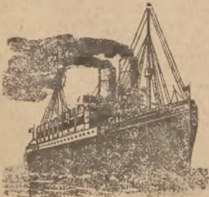
Prospekta darmo i oplatnie.