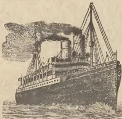
Prospekta darmo i opłatnie.