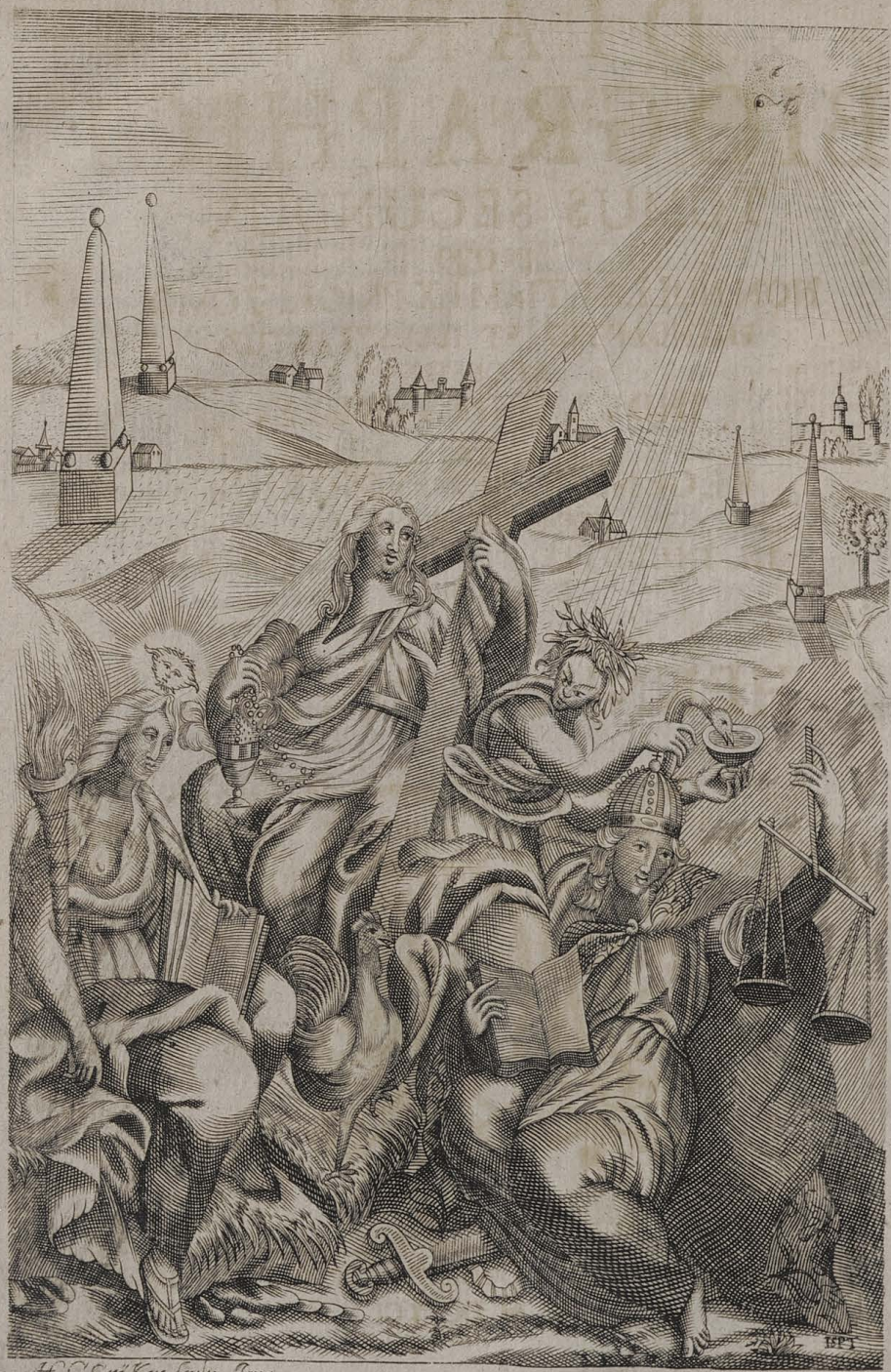
A. C. Crüker. sculp. Inna.