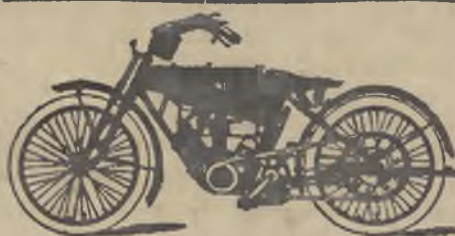
WANDERER-WERKE A. G. SCHÖNHAU ROßO CHEMNITZ.

Chcicie nabyć ładne resztki, które możecie obdzielić całą rodzinę, zamówcie je w tkalni M. Jrsové Novy Hrádek n/M. Resztki można użyć na różne potrzeby. Zedry, barchany, flanele, płótna, kanafasy, perkalę, kawałki 2—8 m. długie 40 m. za 20 koron franko, albo połowa za 10 koron nie frankowane za zaliczką. Nieodpowiadnie przyjmują napowrót, albo zwracam pieniądze. Niema więc ryzyka.