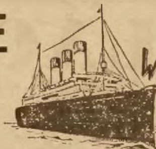
MAJESTIC 22.000 t.