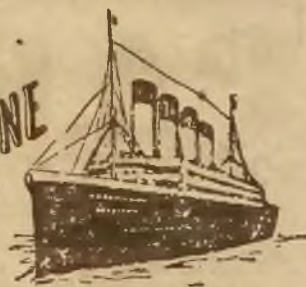
OLYMPIC 21.000 t.