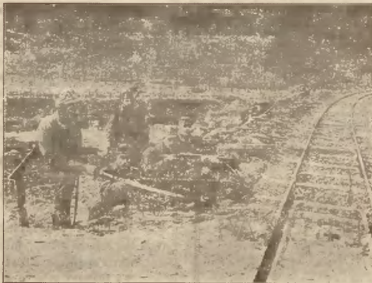
Pluton kompanii podhalańskiej I. III pułku Legionów na pozycyi w Rafajłowej.

Podholame, legioniści I-jej kompanije 3-go pułku.