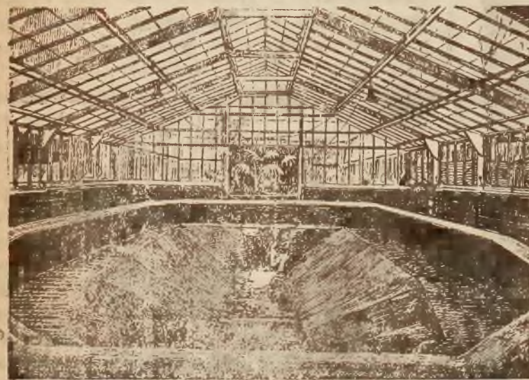
Wnętrze prawego skrzydła nowobudującej się olbrzymiej palmiarni w Parku Wilsona. Na pierwszym planie basen dla wspaniałej rośliny Viktorji Regji i innych roślin egzotycznych.

mentu, 30 wagonów żelaza, przeprowadzono 8 klm. dróg dla pieszych, 12 klm. sieci wodociągowej i t. d.