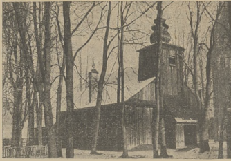
Zabytkowy kościół na Podhalu.

Calej tej mowy p. Agronoma wysłuchano z wielkim zainteresowaniem kiedy padły słowa, że musimy zabrać się do pracy, bo tego od nas wymaga Państwo lekko zaczęli się poruszać. Poruszenie to: zaciskanie pięści przeciw obcym zakusom! Z błyszczących oczu wyczytać można było, że każdy chce podnieść swoją gospodarkę na poziom wyższy, skoro i od niego ma zależeć zwycięstwo!