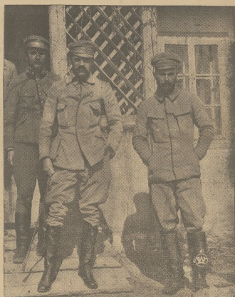
Zdjęcie przedstawia — kpt. Tadeusz Zbigniew Kasprzycki. Komendant Józef Piłsudski i mjr. Edward Śmigły-Rydz (kwiecień r. 1915).