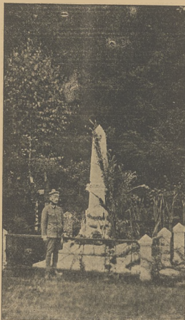
Pomnik poległych legionistów w Marcinkowicach

Komitet Kobiet Polskich. Komitet ten zakłada w roku 1914 w Nowym Sączu pierwszy na ziemiach Polski Szpital Legionowy. Tenże Komitet — przy ofiarnej pracy członkini zdobyła ofiarować wojskom polskim, niedługo po wybuchu wojny 300 apteczek polowych i zbiera 1.600 sztuk bielizny dla legionistów.