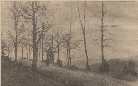
Druga: Grybów - Berest

Pod zaborem austriackim Grybów nie podniósł się bardzo, bo do rozwoju miasta również nie przyłączyli się miesz-