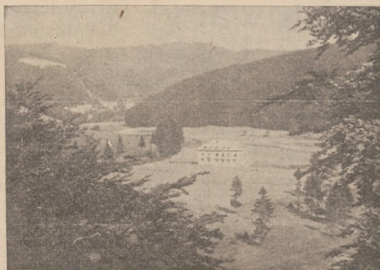
Piękny widok podhalański