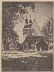
Stary kościółek na Podhale