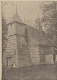
Kościół w Rzeplianiku