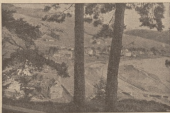
Ogólny widok Maszyny

To samo oczywiście odnosi się do samorządu, który w życiu gospodarczo-społecznym państwa ma zakreszone bar-