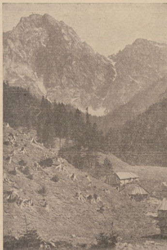
Dolina Strązyska w Tatrach.