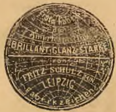
Złoty medal Paryż 1900.