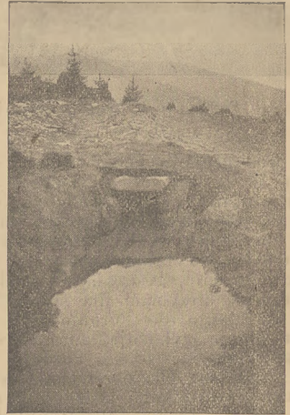
Szczawa: Wlot do doprowadzalnika.

weści nawodnień, nie pozwala na wypowiedzanie podobnych twierdzeń, tembardziej, że obserwacje z wielu okolic tych stref przeczą tym twierdzeniom. Zanim szczegółowe badania pozwolą kiedyś na wydanie w tej sprawie miarodajnej opinii, zwrócimy w krótkości uwagę na obserwowane w tych okolicach zjawiska, i przedstawimy usiłowania