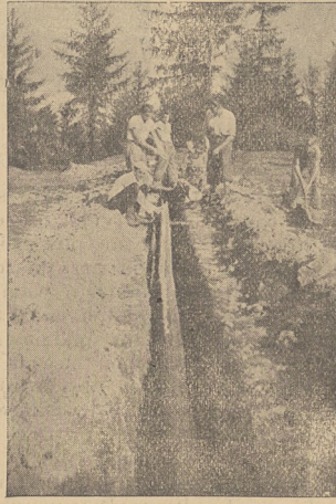
Szczawa: Zakładanie krytego doprowadzalnika z rur drewnianych żłobionych.