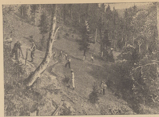
Szezawa: Wykańczanie rowka nawadniającego i wyrównywanie stoku.

przyczem daje się to odczuć przede wszystkim w otwartych, niczem niezasłoniętych przestrzeniach. Zebrane powyżej fakty pozwalają zatem do wysnucia przypuszczalnych ogólnych wniosków, jeżeli chodzi o warunki wzrostu traw na łąkach i pastwiskach górskich. Otóż chodziłoby o podkreślenie, że spodziewany zapas wilgoci z zimy może zawieść, a nawet, jak widać z przytoczonej na początku obserwacji, zawodzi. Mniej dni opadowych w okresie zimowym w górach, aniżeli w nizinach i to w okresie, kiedy właśnie wilgoć w glebie się magazynuje, a przytem wyższa znacznie temperatura i duża insolacja, a zatem podniesiona możliwość parowania, nie mogą sprzyjać intensywnej wiosennej wegetacji traw. Dodać jeszcze trzeba do tego — jako czynniki ujemne — spadziłość stoków, a więc udatwioną możliwość spływu i wiatry, które zwiwają opady śnieżne, utrudniając równomierny rozkład pokrywy śnieżnej.