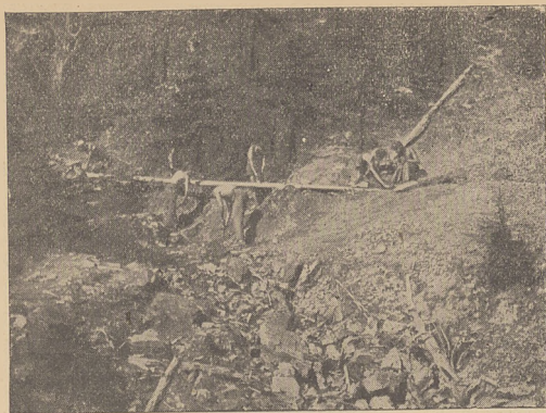
Szezawa: Przekroczenie potoku i ujęcie wody drewnianą rynną żłobioną.